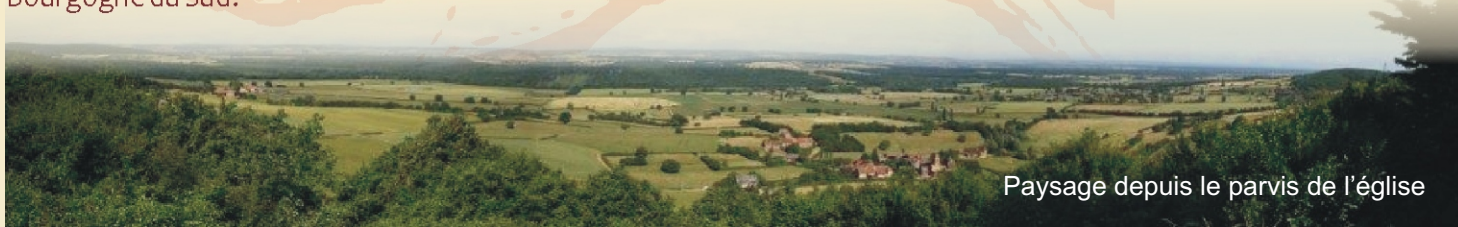
Paysage depuis le parvis de l'église

La barbette sud abrite la résurgence d'une source ; ses fondations remonteraient à l'époque gallo-romaine. La barbette nord, édifiée au XIXe siècle, est reliée ingénieusement à sa sœur aînée par une canalisation selon le principe des vases communicants et complétée de deux auges destinées au bétail. Elle permet surtout de faciliter l'accès à cette eau, précieuse pour les habitants de Brancion. Encore au début du XXe siècle, des femmes la puisaient et la remontaient courageusement à Brancion dans des seaux attachés à l'équivalent d'un joug, porté directement sur leurs épaules. Mais c'était aussi, heureusement pour elles, une occasion de rencontres, tout en lavant leur linge, au bord du lavoir dont ne subsistent que des vestiges. Ces deux barbettes revivent grâce à leur restauration par des équipes internationales de jeunes bénévoles des chantiers REMPART Bourgogne. D'où provient la dénomination “barbette” ? - soit de la racine celte “barb” d'où nous viennent par exemple les mots bourbeux, barboter, en accord avec ce lieu, - soit de l'évocation de la guimpe portée du XIIe au XVe siècle par les femmes âgées et les religieuses.